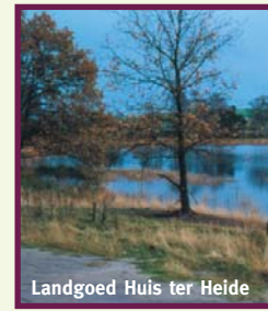
Landgoed Huis ter Heide

schap ten westen van De Moer tot aan de kern van Kaatsheuvel. Naast kleinschalige akker- en weidepercelen worden in dit gebied diverse bospercelen en boomsingels aangetroffen.