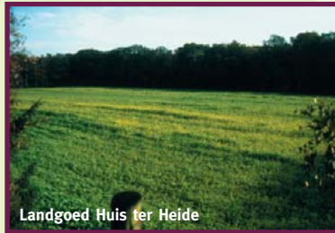
Landgoed Huis ter Heide